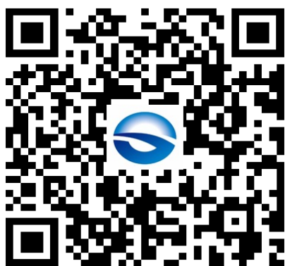
海洋金控 监督举报平台

今年以来，海洋金控纪委坚持围绕服务公司“四个中心”建设，聚焦重点工作任务，积极探索监督新模式，搭建“互联网+”监督举报平台，拓宽问题线索来源渠道，为海洋金控高质量发展提供坚强的纪律保障。