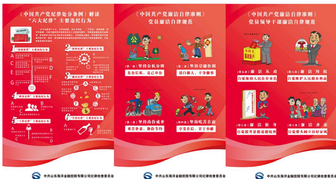
(图为党规党纪解读展板)

中秋、国庆“双节”在即，海洋金控纪委采取“三个有效措施”，提醒广大党员干部知敬畏、存戒惧、守底线，做到廉洁过节、文明过节。