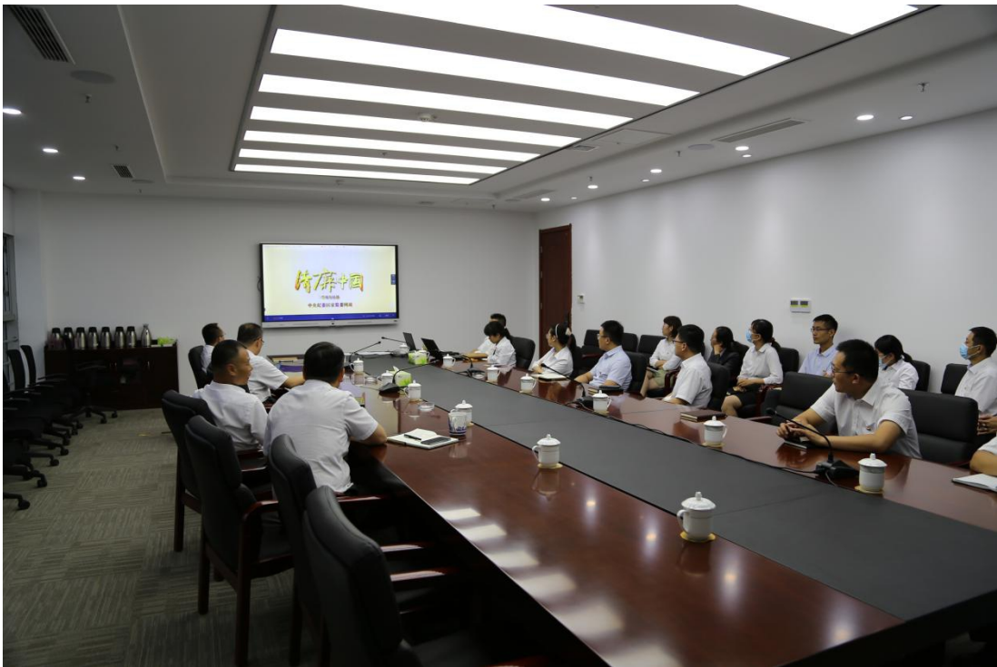
（图为观看廉洁微电影现场）

以廉洁微电影强化警醒。 海洋金控纪委精心选取《雅贿：钱局长的套路》《不要让你的贪心，成为儿女的伤心》《“一分钱没花，事就办了”》等三部中央纪委监委第五届“清廉中国”展播微电影，组织公司及权属企业领导班子成员、全体党员、党风廉政监督员共同观看。活动结束后，大家纷纷表示，微电影的内容很有针对性，既不失幽默，又能起到警醒作用。